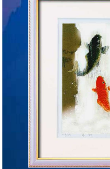
14333 吉岡浩太郎『開運』風水額(大衣)「夫婦滝のぼり鯉」 ¥20,000 ●商品サイズ／約564×448×20mm 重量1100g ●材質／フレーム：PS樹脂 ●箱入り（サイズ／約476×595×30mm） 重量1450g ●箱形態／ボール箱 ●カートン入数／10枚 ●原産国／日本

幸運来復「鯉の滝昇り」 鯉は黄河の遡り龍門にいたり滝を昇つて竜と化し天に昇る。中国の古事にこのようにあることから古くより風水では鯉の滝昇りの絵は、「家運隆昌」、「金運向上」の象徴として額に入れて飾ると良いとされている。特に玄関に飾ると良いと言われている。