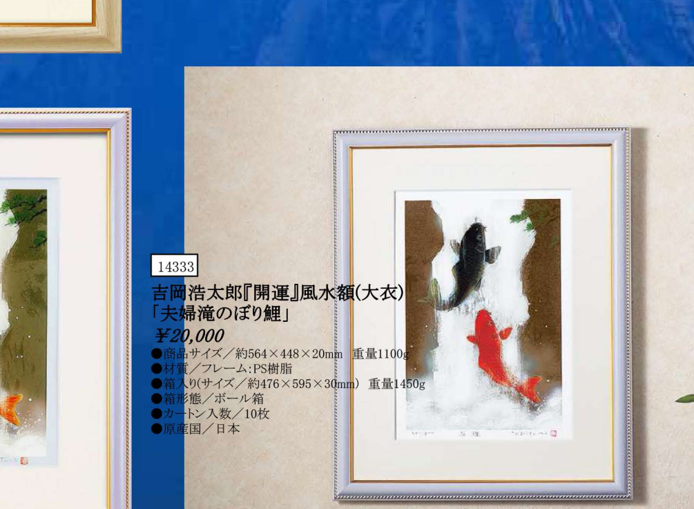
14333 吉岡浩太郎『開運』風水額(大衣)「夫婦滝のぼり鯉」 ¥20,000 ●商品サイズ／約564×448×20mm 重量1100g ●材質／フレーム：PS樹脂 ●箱入り（サイズ／約476×595×30mm） 重量1450g ●箱形態／ボール箱 ●カートン入数／10枚 ●原産国／日本