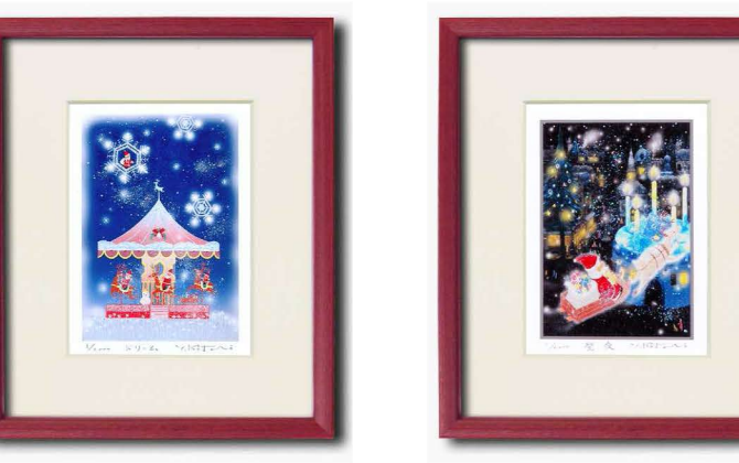
14371 吉岡浩太郎『聖』版画額「ドリーム」 ¥4,000 ●商品サイズ／約220×272×14mm 重量410g ●材質／フレーム：木製 ●日本製 ●箱入り（サイズ／約227×288×20mm） 総重量510g ●箱形態／白箱入 ●入数／20ヶ キラキラ光るラメ入り 14364 吉岡浩太郎『聖』版画額「聖夜」 ¥4,000 ●商品サイズ／約220×272×14mm 重量410g ●材質／フレーム：木製 ●日本製 ●箱入り（サイズ／約227×288×20mm） 総重量510g ●箱形態／白箱入 ●入数／20ヶ キラキラ光るラメ入り