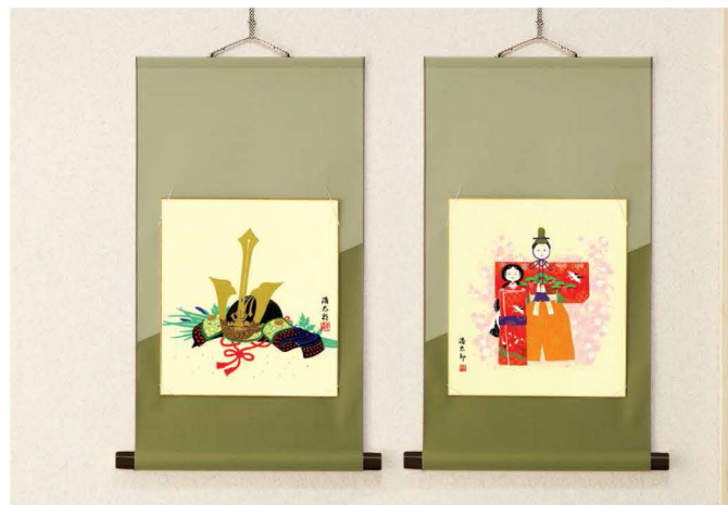
14487 祝い掛軸「端午の節句」 ¥5,000 ●サイズ／約570×30mm 215g ●箱サイズ／約272×310×50mm 390g ●材質／綿100%、PS樹脂 ●日本製 ●箱形態／化粧箱入 ●入数／50 14470 祝い掛軸「雛祭」 ¥5,000 ●サイズ／約570×30mm 215g ●箱サイズ／約272×310×50mm 390g ●材質／綿100%、PS樹脂 ●日本製 ●箱形態／化粧箱入 ●入数／50