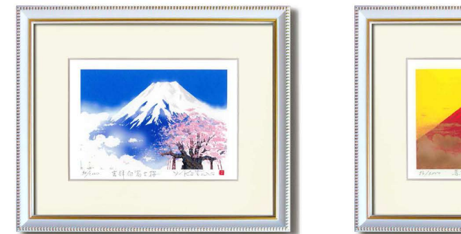
14876 桜白富士 14883 桜赤富士