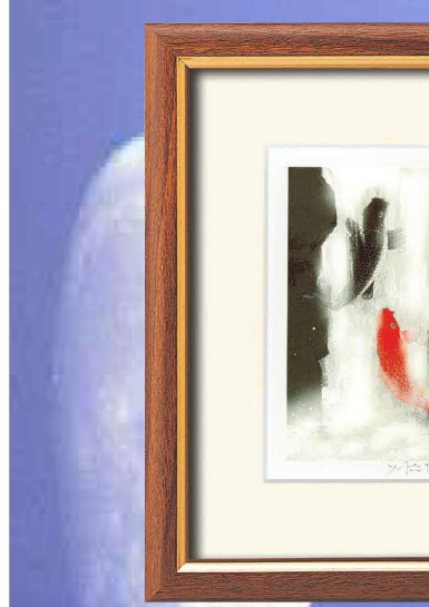
14784 吉岡浩太郎『開運』風水額(スタンド付)「夫婦滝昇り鯉」 ¥5,000 ●商品サイズ／約243×293×19～140mm 重量537g ●材質／フレーム：樹脂 ●箱入り（サイズ／約252×305×20mm） 総重量648g ●箱形態／ボール箱 ●1カートン入数／24個 ●原産国／日本